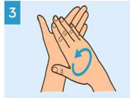
3 Frote las palmas entre si