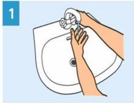
1 Humedezca las manos