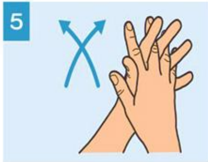
5 Frote las palmas de las manos con los dedos entrelazados.