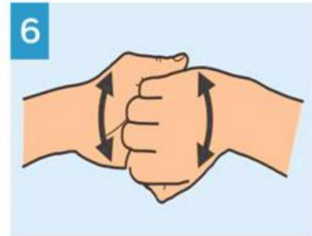
6 Frote el dorso de los dedos con la palma opuesta.