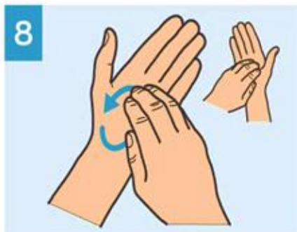
8 Frote la punta de los dedos contra la palma contraria.