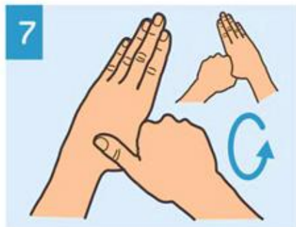
7 Frote con movimiento de rotación los pulgares.