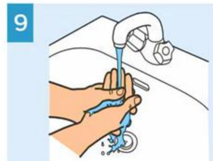
9 Enjuague las manos.